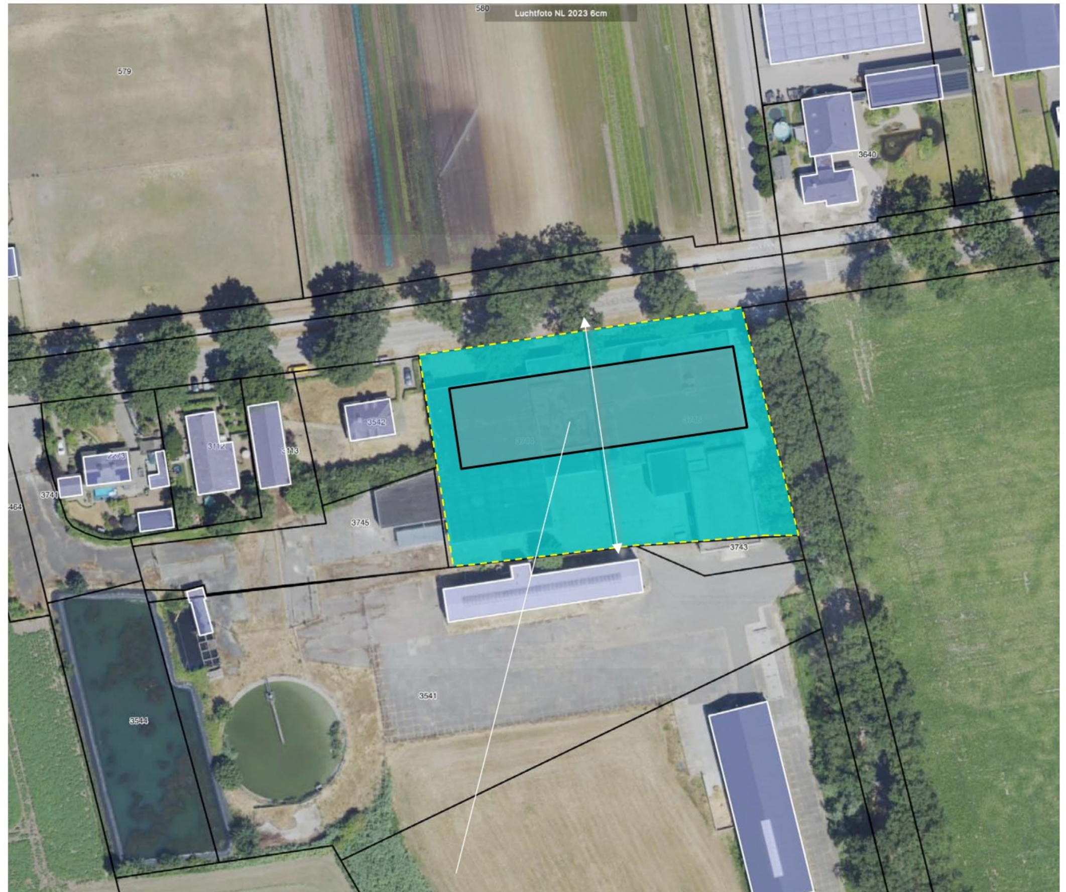
een 'twee onder 1 kap' voor twee bedrijven