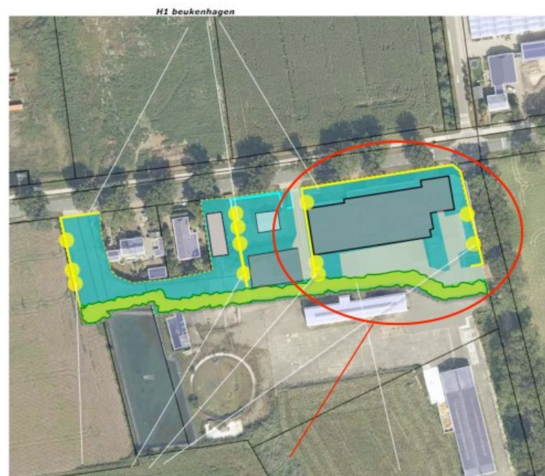
te realiseren beplanting

De in het voorliggende plangebied te realiseren plantverplichting kan in essentie worden uitgevoerd. Uit de nieuwe opzet voortvloeiende aanpassingen zijn beperkt tot een onderbreking in de omzomende haag ten behoeve van de nieuwe inrit aan de Statenweg en het opschuiven van de onderbreking in de haag ten behoeve van de inrit aan de Hoekstraat. Het verloop van de groensingel aan de zuidkant wordt weliswaar enigszins gewijzigd, de omvang blijft echter nagenoeg gelijk. De bomen aan de westkant kunnen in de daar geprojecteerde haag worden opgenomen.