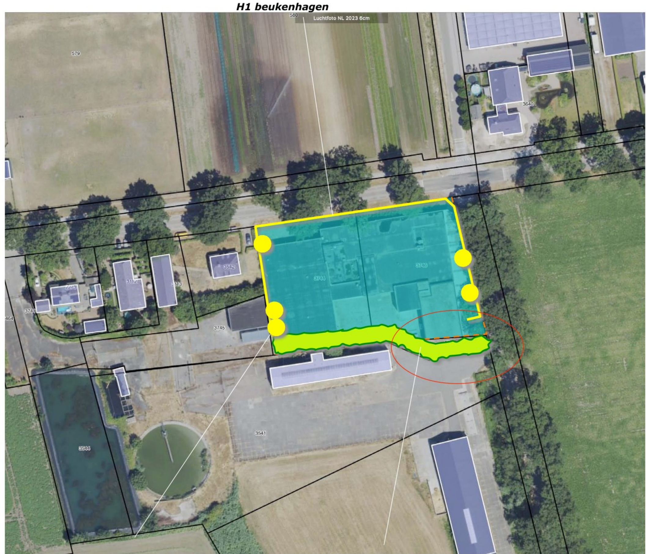
B1 lindes en haagbeuken