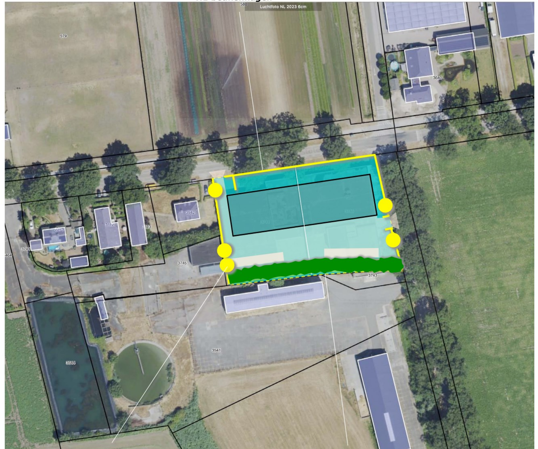
B1 haagbeuken en lindes