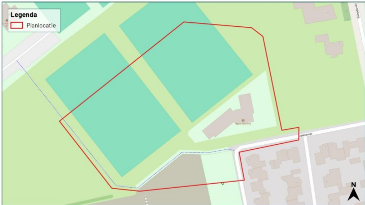
Figuur 1.2 De planlocatie (rood omkaderd) is gelegen aan de Voskuilenweg 2a te Venhorst.

De planlocatie is gelegen aan de Voskuilenweg 2a te Venhorst (figuur 1.2). Het evenemententerrein omvat het verenigingsgebouw en de helft van de twee naastgelegen velden. Het verenigingsgebouw is opgetrokken uit baksteen muren met luchtspouw en bestaat uit één bouwlaag. Naast het verenigingsgebouw is een parkeerplaats aanwezig. De voetbalvelden bestaan uit natuurlijk gras. In figuur 1.3 en bijlage 1 zijn een aantal foto's opgenomen die een impressie geven van de planlocatie en de directe omgeving hiervan.