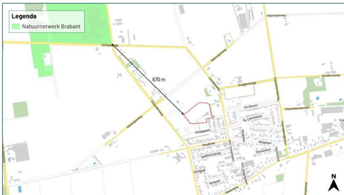
Figuur 3.2 De planlocatie ligt op een afstand van circa 670 m tot het Natuurnetwerk Brabant.