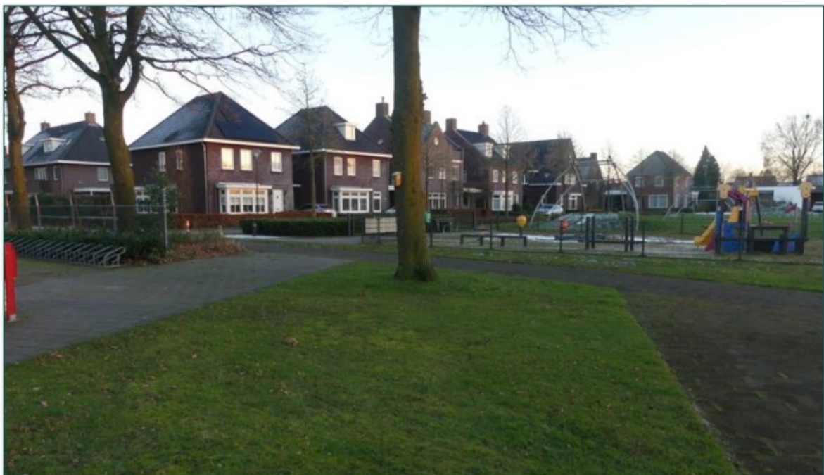
Figuur 1.3 Fotografische indruk van de omgeving van de planlocatie.

De directe omgeving van de planlocatie wordt met name gekenmerkt door de agrarische percelen. Ten zuidoosten van de planlocatie is de bebouwde kom van Venhorst gelegen. Op circa 1,2 km ten oosten van de planlocatie is de N277 gelegen.