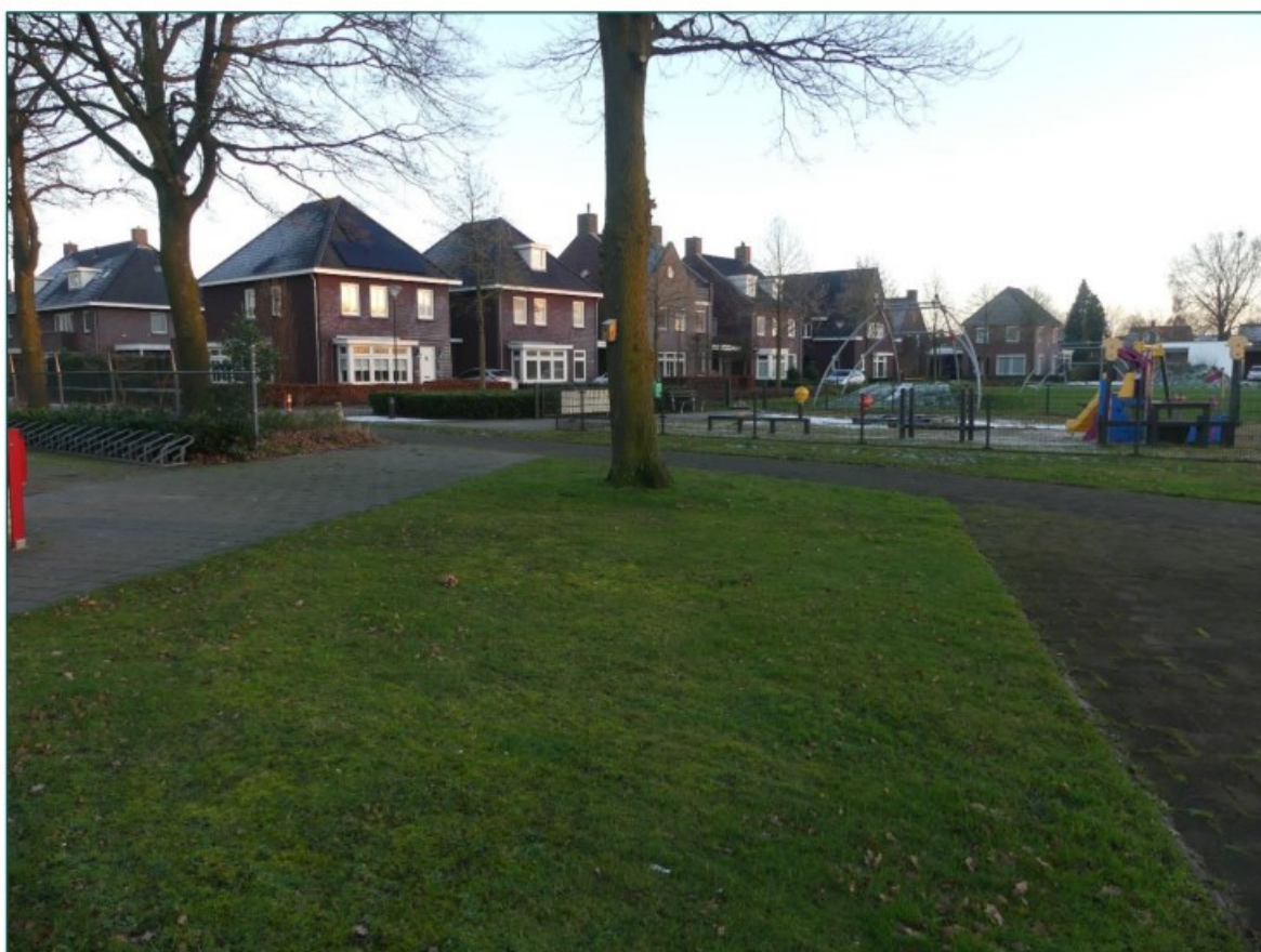
Figuur 2 De speeltuin en eiken ten zuiden van de planlocatie.