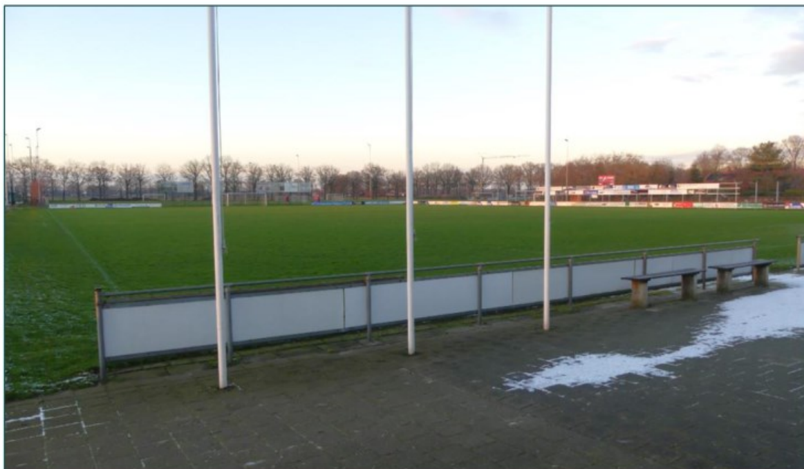
Figuur 1.1 De planlocatie is gelegen aan de Voskuilenweg 2a te Venhorst.