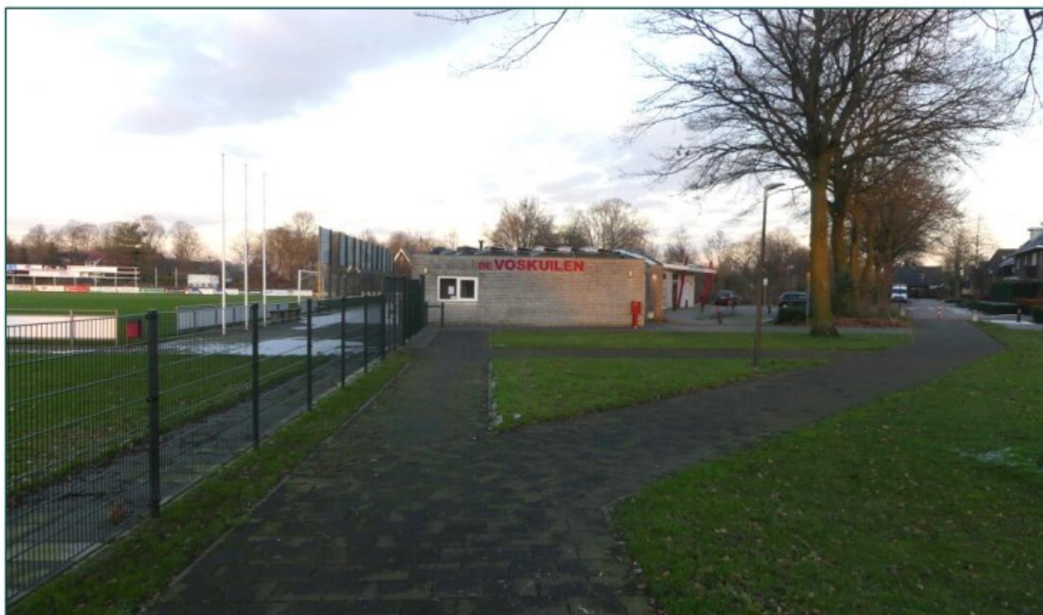
Figuur 1 Het verenigingsgebouw op de planlocatie, gezien vanaf de westzijde.