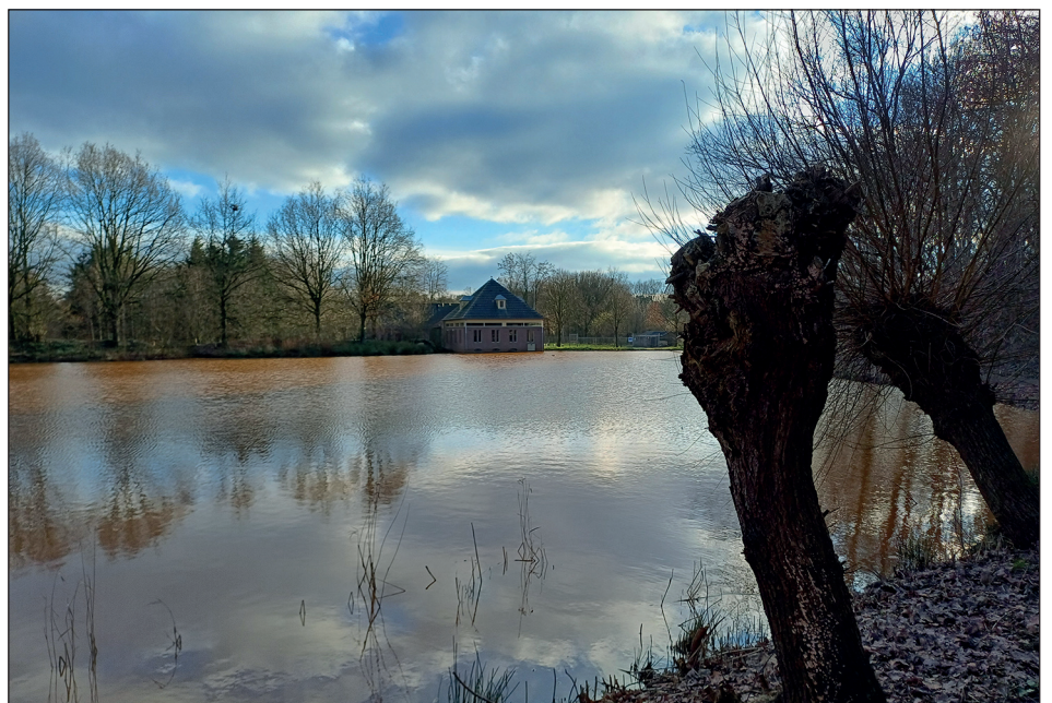
Breukenland - Perekker in de winter

Breukenland is een initiatief van Pop-Up City en wordt ondersteund door Geopark Peelhorst en Maasvallei i.o., provincie Noord-Brabant, Streekfonds De Maashorst en de gemeenten Boekel, Deurne en Venray. Deze zijn al lid van het Geopark.